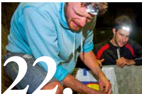
22. Leven uit de vuilnisbak.