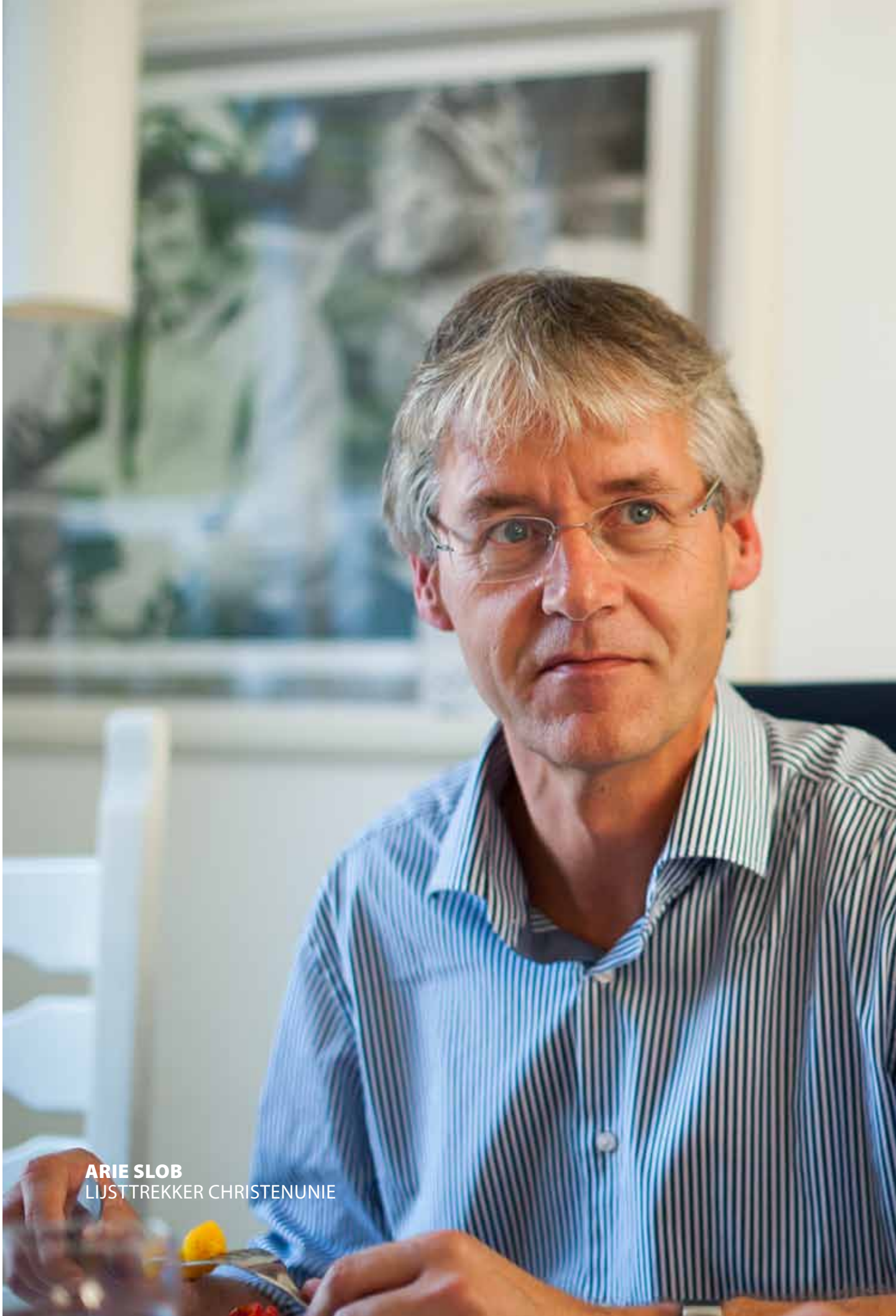
ARIE SLOB LIJSTTREKKER CHRISTENUNIE