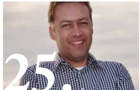
25. Herindelingsverkiezingen: Wat betekent dit voor lokale fracties?