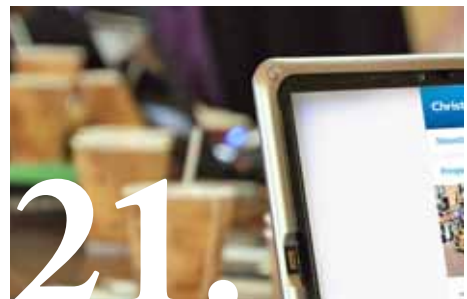
21. Geef uw e-mailadres door en mis nooit meer iets over de ChristenUnie.