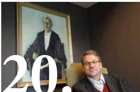
20. Gastcolumn Paul van Geest: Identiteit en authenticiteit.