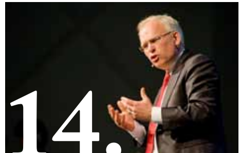
14. Partijvernieuwing: de stand van zaken.