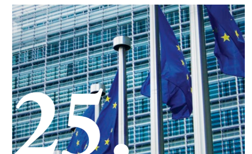
Geef geloof een stem, vooral in Europa