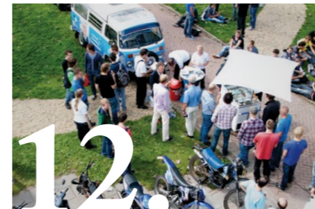
Campagne! Kijk hoe u mee kunt doen