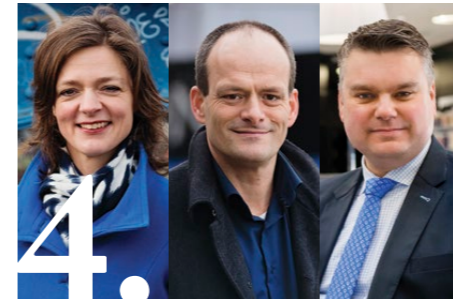
Gemeenteraadsverkiezingen 2014: Mensen maken de stad