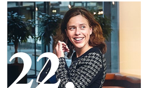
Carola Schouten: “Economie moet dienstbaar zijn aan mensen.”