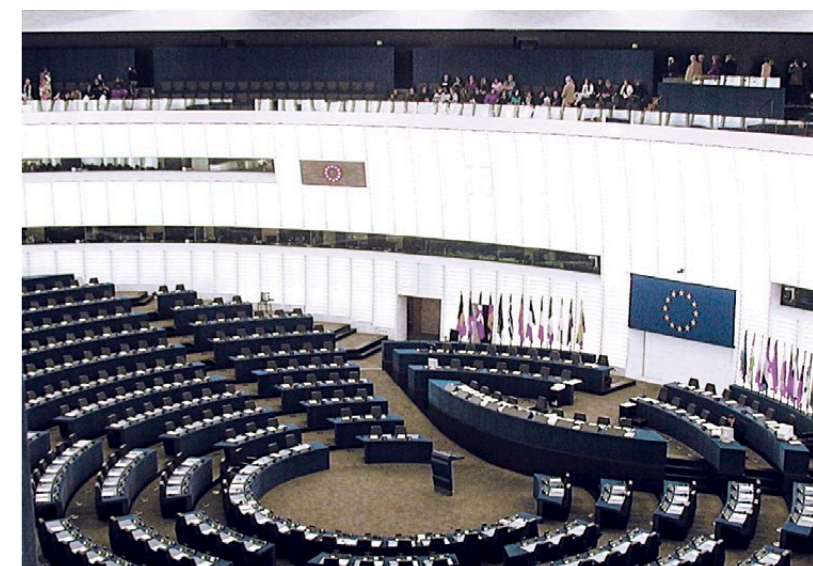
Het Europees Parlement in Straatsburg ^

Jullie gaan de komende verkiezingen ook intensief met de SGP samenwerken. Gaan jullie hetzelfde geluid laten horen? "Absoluut. We hebben een gezamenlijk programma en de campagne naar de komende verkiezingen toe zullen we ook samen voeren. In de hoop dat we christelijke politiek nog beter op de Europese kaart kunnen zetten de komende vijf jaar. Als alle kiezers die bij de vorige Tweede Kamer verkiezingen op de ChristenUnie of de SGP hebben gestemd dat nu weer doen, dan halen we drie zetels in het Europees Parlement. Dat zou geweldig zijn!"